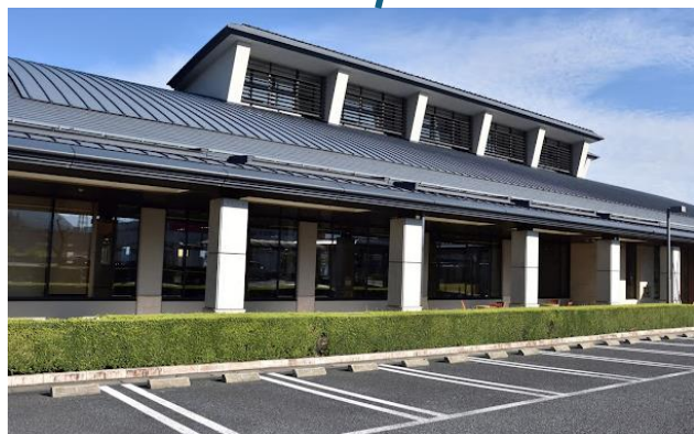
恵那市中央図書館